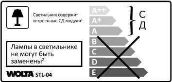
1 Шамда кірістірілген ЖД модульдері бар

Өндіруші: Ningbo Yusing Lighting Co., Ltd. Мекен-жайы: № 1199 Мингтуанг жолы, Цзяншань қаласы, Инчжоу, Нинбо, Қытай. Қытайда жасалған. Жеткізуші / импорттаушы «Вольта» ЖШҚ, Ресей, 197198, Санкт-Петербург, Ждановская көшесі, 45 литр А үйі, 60-Н үй, 14 кеңсе, www.wolta.ru. Жеткізушінің (Өндірушінің) тұтынушыдан талап-наразылықтады қабылдауға уәкілеттік берген заңды тұлғаның атауы мен мекен-жайы: «Ле Мон-лид Қазақстан» ЖШС, 0500051, Қазақстан Республикасы, Алматы қ., Медеу ауданы, Достық даңғылы, 192/2 үй, 819, info@wolta.kz.